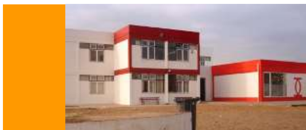
EB de Alhos Vedros