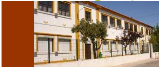
EB de Alhos Vedros nº1