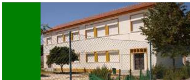
EB de Alhos Vedros nº2